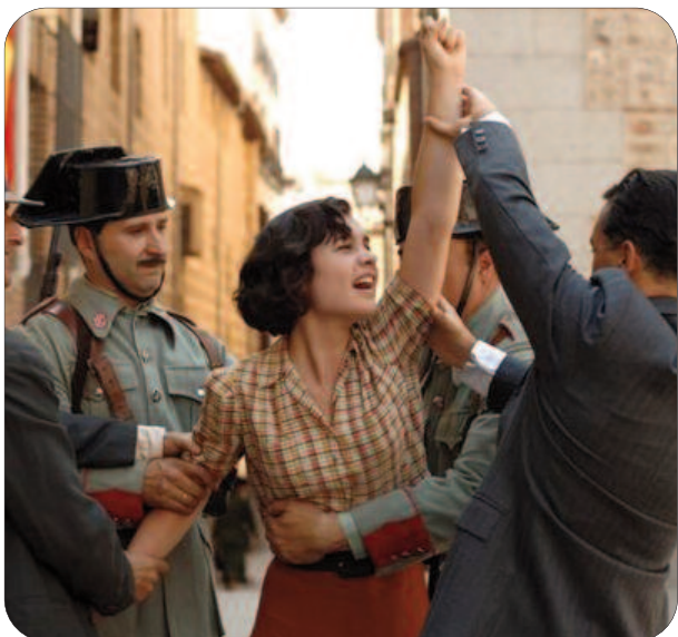
Scena del film inaugurale della 63a stagione

GIOVEDÌ 8 OTTOBRE 2009 INIZIANO LE PROIEZIONI DEL NUOVO ANNO